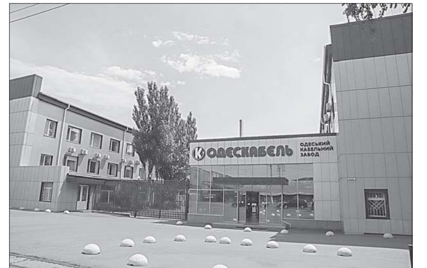
Добро пожаловать на «Одескабель».

ци. Само собой — игрушки и подарки. Получали помощь одесские ВУЗы, спортивные федерации и воинские части.